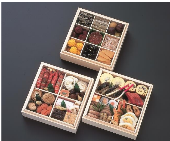
三段重 ¥48,600(税込) 4人前 19.6cm×19.6cm×5.8cm

二傳(にでん)本店 〒604-8267 中・姉小路通油小路西入ル鍛冶町142 電話：075-221-3908 (水曜を除く10~17時) ファックス：075-221-6044