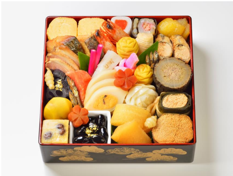
一段重・ 佳肴 ¥29,160(税込) 2~3人前 19.6cm×19.6cm×5.3cm