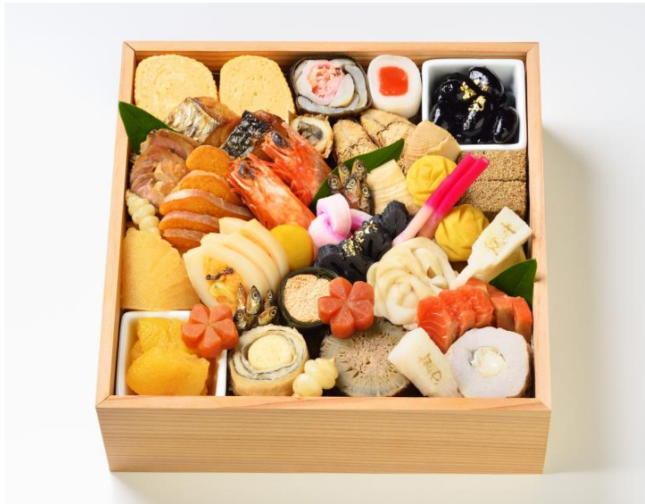
一段重・ 吉祥 ¥39,960(税込) 2~3人前 21cm×21cm×6cm